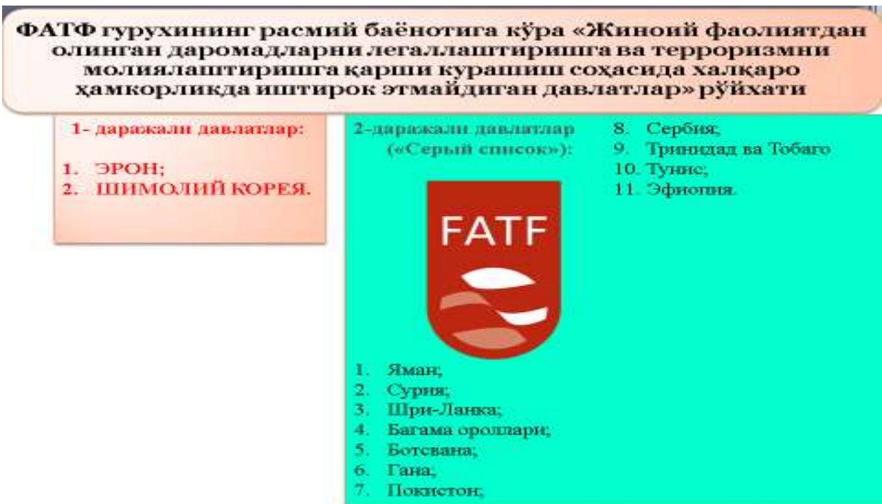
4-расм. Жиноий фаолиятдан олинган даромадларни легаллаштириш ва терроризмни молиялаштиришга қарши курашишда қатнашмайлиган давлатлар 4