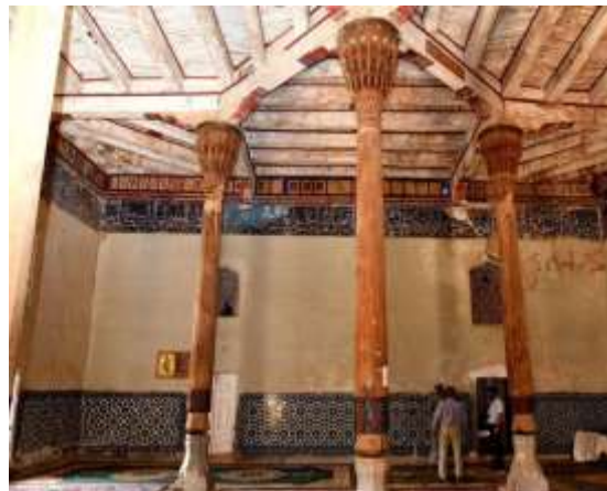
3-расм. Лангар ота мажмуасининг ички кўриниши.

Ушбу архитектура ёдгорлигида меморчиликнинг ноёб дурдоналаридан булмиш масжид ва мақбарадан ташкил топган. Ўрта Осиёнинг турфа нақш санъатини ўзида мужасам этган. Лангар ота масжидида арабий ёзувининг кўфий усулида битилган тахминан VII – асрга тенг Қуръон нусхаси сақланган.