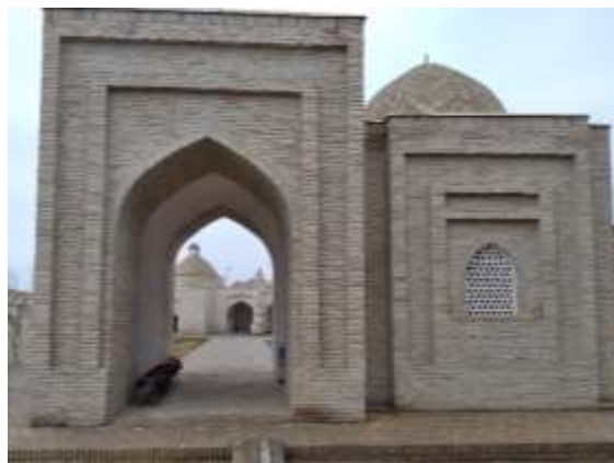
2-расм. Ҳазрати Қусам Ота мажмуаси

Қашқадарё вилояти Косон туманида Пудина қишлоғида жойлашган Ҳазрати Қусам Ота мажмуаси Буюк ипак йўлида жойлашганлиги фикримиз далилидир. Ўша ернинг маҳаллий аҳолиси ва олимларнинг фикрича Пудина қишлоғи Буюк ипак йўлида жойлашганлиги ва маданий марказ сифатида IX