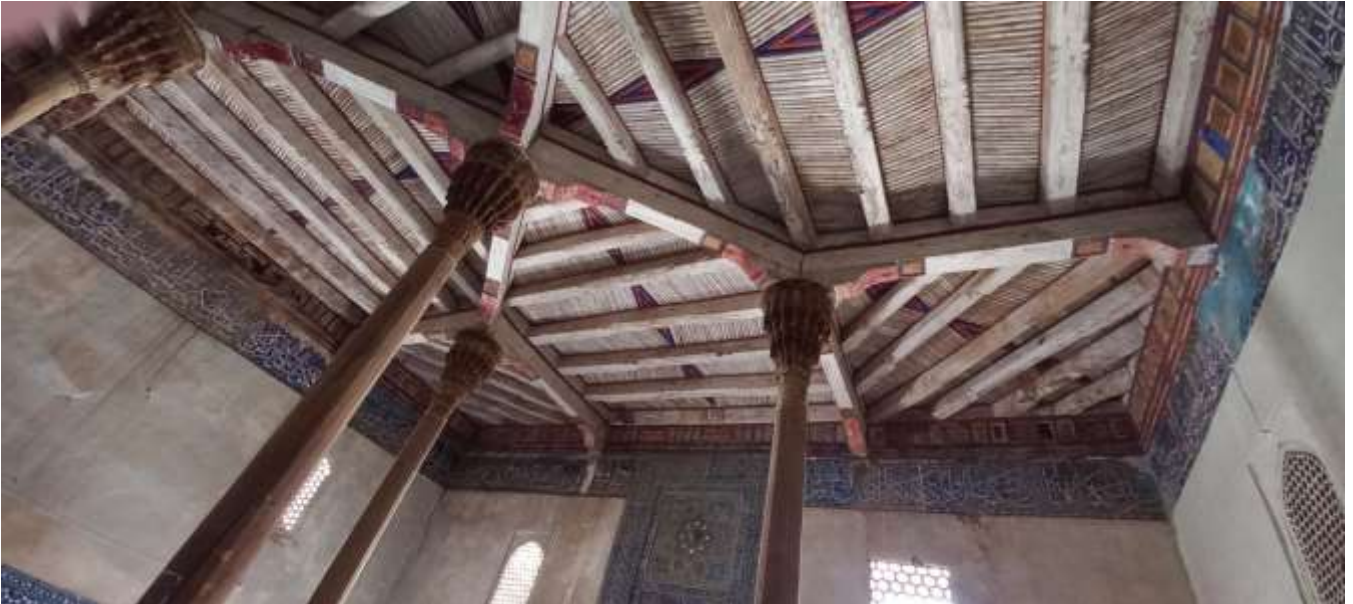
4-rasm. Xazrati Langar ota masjidining ichki ko'rinishi.

Yuqoridagisi qanday imloligi, bezakmi yo ramziy belgilarmi – ma'lum emas. Qizig'i shundaki, ular to'g'ri chiziqlardan hosil qilingan bo'lib, ko'pi svastika shaklidir. Bunday ramzlar qadimgi turkiy xalqlar buyumlarida, lavhalarda ko'p uchraydi. Jumladan, qo'ng'iroq va qutchi o'zbeklarining o'tovlariga yopilgan kigizlarda, g'ojari gilamlarida, qurlarida, bog'ish va tizmalarida aynan shunday naqshlarni ko'ramiz. Mutaxassislarning fikricha, bu bezaklar Ko'k turk podsholarining ishoralari, aniqrog'i davlat ramzlari ekan. Bu fikrni inkor etmagan holda ta'kidlash joizki, ular bezak yoki ramzlar bo'libgina qolmay, diniy, siyosiy aqidalar va qonun-qoidalarni anglatuvchi iboralar hamdir. Shundan ko'rinadiki, bu belgilar xuddi xitoy iyerogliflari kabi imlo vazifasini o'tagan. Zero, iyerogliflar ham alohida harf va tovushlarni emas, balki narsalarni, harakatni, tushunchalarni ifodalagan.