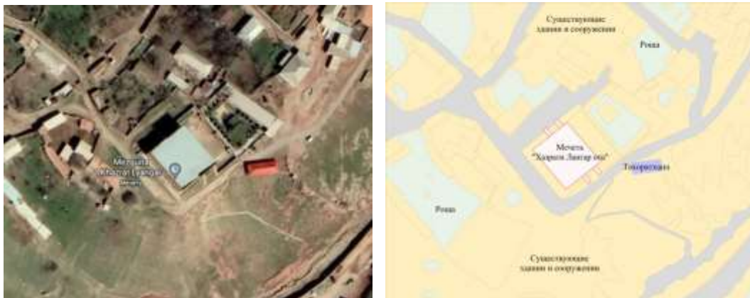
1-rasm. Xazrati Langar ota masjidining bosh tarxi.

Qashqadaryo viloyati Qamashi tumani Qiziltepa qishlogʻidan 25-30 kilometr olislikda, Hisor togʻ tizmalari oraligʻida joylashgan Langar ota ziyoratgohi qadimiy xonaqoh-maqbaralar sirasiga kiradi. Masjid 1520-yillarda bunyod etilgan, oʻrta asrlar Markaziy Osiyo meʼmorchiligining noyob namunasi boʻlgan ushbu masjid va maqbarasida tasavvuf taʼlimotining yirik vakillari abadiy qoʻnim topgan [2].