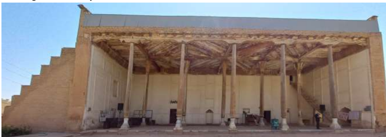
2-rasm. Xazrati Langar ota masjidining old umumiy koʻrinishi.

Oʻrta asr muarrixi Ibn Xavqal mazkur qishloq hududi qadimda Kesh viloyatiga boʻysunuvchi Siyam tumaniga qarashli boʻlgani, tumanning nomi, ayniqsa, milodiy 776 yildan soʻng juda mashhur boʻlgani haqida yozadi. Abu Rayhon Beruniyning qayd qilishicha, Siyam tumani va unga yaqin joylarda soxta paygʻambar Mazdak gʻoyalari tarqalgan. Dalillardan Langar qishlogʻi tarixi uzoq asrlarga borib taqalishi maʼlum boʻladi. Bu yerda olib borilgan arxeologik qazishma ishlari paytida Somoniylar davriga oid gʻishtlar topilgani bu manzilgoh ushbu sulola hukmronligi davrida ham faoliyat koʻrsatganini isbotlaydi.