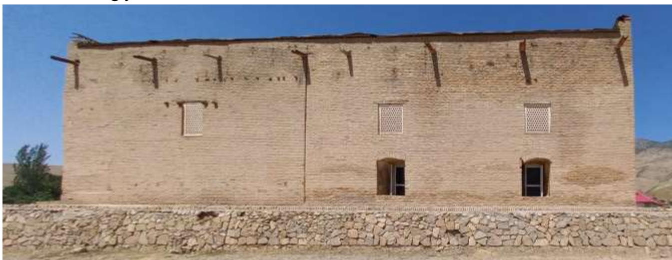
3-rasm. Xazrati Langar ota masjidining orqa umumiy ko'rinishi.