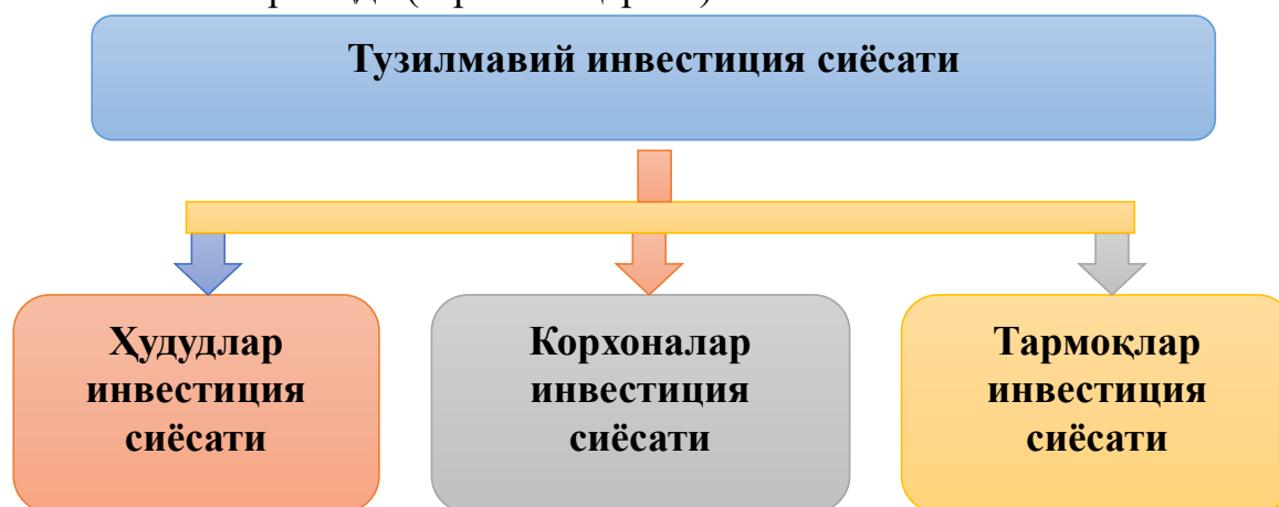
2-расм. Ўзбекистон Республикасининг тузилмавий инвестиция сиёсати 4

Мустақилликка эришилгандан бошлаб, мамлакатимиз бозор иқтисодиётига ўтишнинг ўзига хос йўлидан бормоқда. Бу йўлда инвестиция сиёсатининг аҳамияти жуда катта. Чунки инвестициялар иқтисодиётда таркибий ўзгаришлар, техник ва технологик янгиланишлар, корхоналарни қайта таъмирлаш ишларини амалга оширишни рағбатлантиради, мамлакат экспорт ва импорт салоҳиятини оширишга имкон яратади. Шу жиҳатдан Ўзбекистон ўз тузилмавий инвестиция сиёсатини олиб бормоқда (1-расмга қаранг).